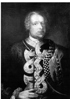
Trenckův portrét z pol. 18. století...

V roce 1872 byl do kaple přepohřben baron Trenck . V 70. letech 20. století sem byl pak přesunut relikviář křesťanky Klemenciány . Oltář pod relikviářem je z poloviny 17. století a dodnes slouží k bohoslužbám.