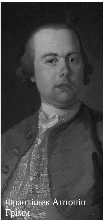
Франтішек Антонін Грімм

Також зверніть увагу на невеликі отвори в склепіннях. Йдеться про вентиляцію. Коли капуцини хотіли використовувати підвальні приміщення без вікон (ті, що праворуч-сучасні), їм доводилося їх якось провітрювати. Сьогодні функціональним є лише один отвір. Решта вентиляційних отворів були зруйновані під час жозефінської реформи 1784 року, яка заборонила поховання в центрах міст.