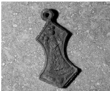
Медальйон хлопчика, похованого тут

Зліва в кутку можна побачити кістницю, яку капуцини побудували в 90-х роках 20 століття. Останки покійних, тіла яких з часом розклалися, також помістили у закриту труну поруч з кістницею.