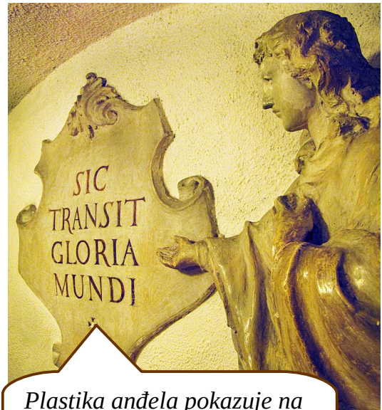
Plastika anđela pokazuje na latinski natpis Sic transit gloria mundi , u prijevodu Tako prolazi slava svijeta .

Zahvaljujući sofisticiranoj ventilaciji, u grobnici nam se očuvala jedinstveno velika količina drvenih ljesova iz 18. stoljeća. Njihove poklopce možete vidjeti obješene na zidovima oko sebe. Izrađeni su uglavnom od hrasta, a neki pak od bora. Ukrašeni su ručnim oslikavanjem uljanim bojama. Najčešći motiv je Isus na križu kao izraz nade u uskrsnuće, dalje pak biljke, šipak ili lubanje i ukrštene kosti.